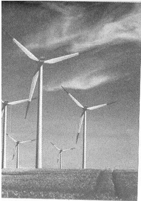
7 parcs éoliens.

du parc éolien de Taza (150 MW), dont le contrat d'achat d'électricité a été signé en juillet 2013. Pour un coût s'élevant à 1,7 milliard de dollars (environ 14 milliards de DH), le programme des 850 MW se compose de cinq parcs éoliens : «Midelt», 150 MW, «Tiskrad (Tarfaya)», 300 MW, «Tanger II», 100 MW, «Jbel Lahdid (Essaouira)», 200 MW et «Boujdour», 100 MW, à mettre en service entre 2016 et 2020. Le projet comporte, en outre, une option pour la fourniture et la maintenance des éoliennes nécessaires à l'extension de 200 MW du parc éolien de Koudia Al Baida. L'ONEE précise qu'il a levé pour ce projet des financements concessionnels, à hauteur de 385 millions d'euros et 31 millions de dollars (soit l'équivalent de 4,5 milliards de DH), auprès des bailleurs de fonds. La Banque européenne d'investissement (BEI) a contribué pour un